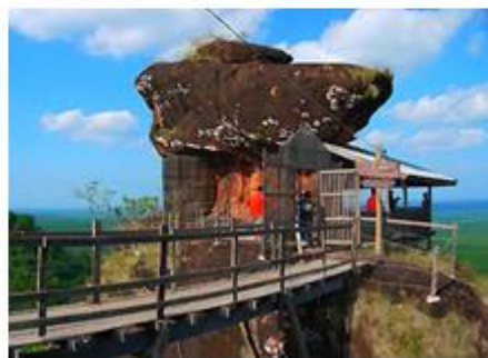
ภาพ: ภูทอก อำเภอสรีวิไล

๕) วัดสว่างอารมณ์ (วัดถ้ำศรีธน) ตั้งอยู่ที่ตำบลปากคาด อำเภอปากคาด วัดตั้งอยู่บริเวณเนินเขา ภายในบริเวณวัดมีโขดหิน หน้าผา ลานหิน มีต้นไม้ปกคลุมทั่วไปเป็นที่ร่มรื่นมีลำธารเล็กๆ ไหลผ่านอุโบสถทรงระฆังคว่ำ ตั้งอยู่บนเนินสูงภายในเป็นที่ประดิษฐานพระพุทธรูปศักดิ์สิทธิ์ บนอุโบสถสามารถมองเห็นทิวทัศน์รอบด้านทั้งทางฝั่งไทยและฝั่งลาว