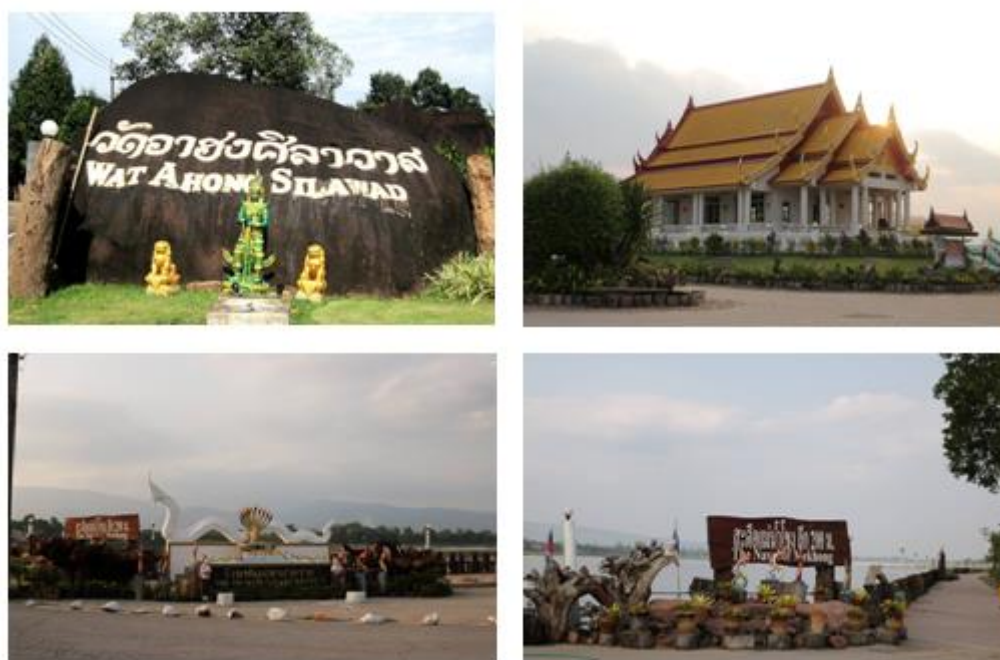
ภาพ: วัดอาฮงศิลาวาส อำเภอเมืองบึงกาฬ

๓) ศาลเจ้าแม่สองนาง อำเภอเมืองบึงกาฬ ศาลเจ้าแม่สองนาง จะเป็นศาลที่ผู้คนใน แถบลุ่มแม่น้ำโขง ให้ความเคารพศรัทธา ในตัวเมืองใหญ่ ๆ ที่อยู่ริมแม่น้ำโขง จะมีศาลเจ้าแม่สองนางให้คนกราบไหว้บูชาเสมอ เช่น ศาลเจ้าแม่สองนางวัดหายโศก จังหวัดหนองคาย ศาลเจ้าแม่สองนาง จังหวัดมุกดาหาร เป็นต้น แต่ประวัติความเป็นมาของเจ้าแม่สองนาง ในแต่ละท้องถิ่นที่มีการเล่าขานแตกต่างกันไปแต่เนื้อหาหลักจะตรงกัน ก็คือ เป็นกษัตริย์ หรือ ชาวล้านช้าง ที่มีลูกสาวสองคน อพยพหนีข้าศึก ล่องมาตามแม่น้ำโขง แล้วประสบอุบัติเหตุ เสียชีวิต แล้วกลายเป็นพญานาคคอยปกป้องรักษา ผู้คนที่อาศัยลำนํ้าโขงในการทำมาหากิน ค้าขาย หรือเดินทาง ทำให้เป็นที่เคารพศรัทธา ของประชาชนทั้งสองฝั่งแม่น้ำโขง