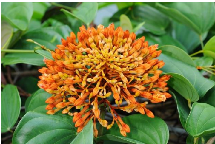
ภาพ: ดอกสิรินธรวัลลี หรือดอกสามสิบสองประดง

คำอธิบาย: สิรินธรวัลลี หรือชื่อพื้นเมือง สามสิบสองประดง ชื่อวิทยาศาสตร์ Bauhinia sirindhorniae K. & S.S. Larsen อยู่ในวงศ์ LEGUMINOSAE – CAESALPINIOIDEAE เป็นพืชถิ่นเดียว และหายากทางนิเวศวิทยาและการกระจายพันธุ์ พบที่จังหวัดบึงกาฬ ตามชายป่าดิบแล้งเขตรักษาพันธุ์สัตว์ป่าภูวัว และบริเวณใกล้เคียงระดับความสูง ๑๕๐ – ๒๐๐ เมตรจากระดับน้ำทะเล