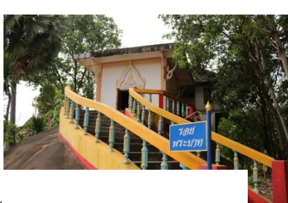
ภาพ: วัดสว่างอารมณ์ (วัดถ้ำศรีธน) อำเภอปากคาด