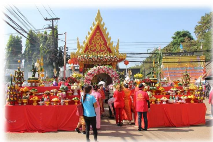
ภาพ: ศาลเจ้าแม่สองนาง อำเภอเมืองบึงกาฬ

๓) ศาลเจ้าแม่สองนาง อำเภอเมืองบึงกาฬ ศาลเจ้าแม่สองนาง จะเป็นศาลที่ผู้คนใน แถบลุ่มแม่น้ำโขง ให้ความเคารพศรัทธา ในตัวเมืองใหญ่ ๆ ที่อยู่ริมแม่น้ำโขง จะมีศาลเจ้าแม่สองนางให้คนกราบไหว้บูชาเสมอ เช่น ศาลเจ้าแม่สองนางวัดหายโศก จังหวัดหนองคาย ศาลเจ้าแม่สองนาง จังหวัดมุกดาหาร เป็นต้น แต่ประวัติความเป็นมาของเจ้าแม่สองนาง ในแต่ละท้องถิ่นที่มีการเล่าขานแตกต่างกันไปแต่เนื้อหาหลักจะตรงกัน ก็คือ เป็นกษัตริย์ หรือ ชาวล้านช้าง ที่มีลูกสาวสองคน อพยพหนีข้าศึก ล่องมาตามแม่น้ำโขง แล้วประสบอุบัติเหตุ เสียชีวิต แล้วกลายเป็นพญานาคคอยปกป้องรักษา ผู้คนที่อาศัยลำนํ้าโขงในการทำมาหากิน ค้าขาย หรือเดินทาง ทำให้เป็นที่เคารพศรัทธา ของประชาชนทั้งสองฝั่งแม่น้ำโขง