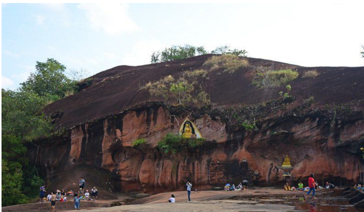
ภาพ : น้ำตกถ้ำพระ ตำบลโสกก่าม อำเภอลือเสาะ จังหวัดบึงกาฬ

๙) น้ำตกเจ็ดสี เป็นน้ำตกอีกแห่งที่อยู่ในเขตรักษาพันธุ์สัตว์ป่าภูวัว อำเภอลือเสาะ จังหวัดบึงกาฬ น้ำตกเจ็ดสี เดิมเรียกว่าน้ำตกห้วยกะอาม ซึ่งเกิดจากธารน้ำของห้วยกะอาม เป็นน้ำตกจากหน้าผาสูงแล้วเกิดเป็นละอองไอน้ำกระทบกับแสงแดดทำให้เกิดสีต่างๆ ขึ้น จึงเรียกน้ำตกเจ็ดสี มีทั้งหมด ๓ ชั้น ตั้งอยู่ในเขตพื้นที่บ้านดอนเสียด หมู่ที่ ๓ ตำบลบ้านดง อำเภอลือเสาะ การเดินทางไปน้ำตกเจ็ดสี เดินทางจากบ้านชัยพร-ทุ่งทราย จก-ดอนเสียด ระยะทาง ๒๒ กิโลเมตร และแยกซ้ายไปน้ำตกเจ็ดสีอีกประมาณ ๖ กิโลเมตร