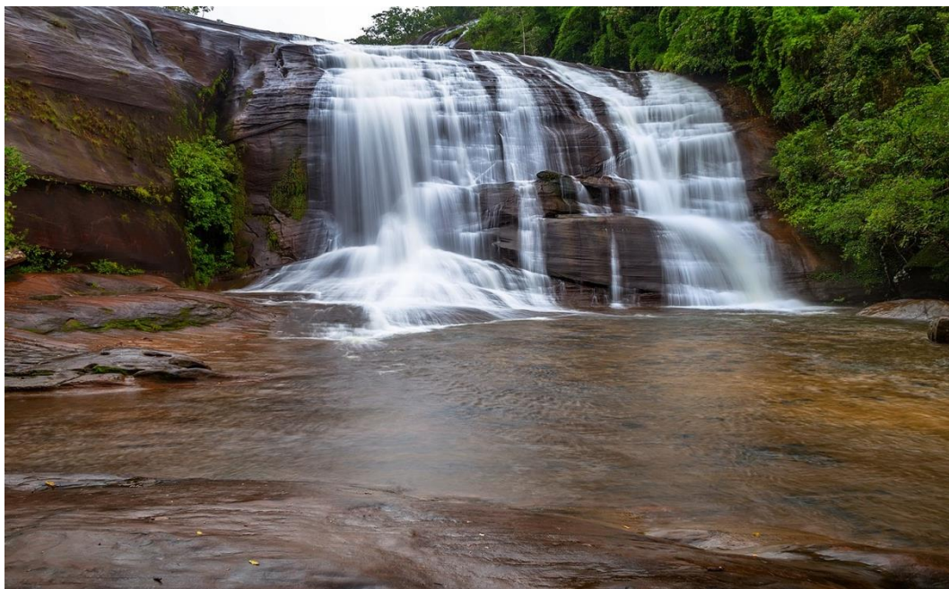
น้ำตกเจ็ดสี ตำบลบ้านด้อง อำเภอเซกา จังหวัดบึงกาฬ