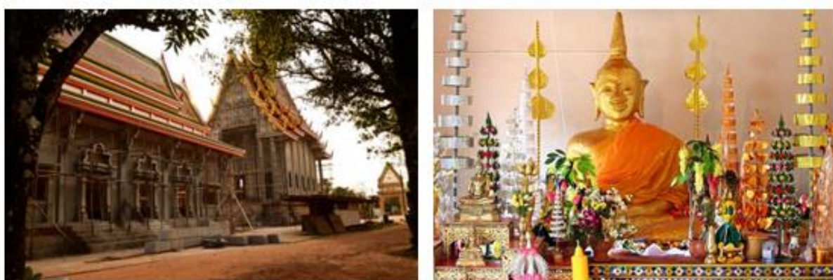
ภาพ: หลวงพ่อพระใหญ่ วัดโพธาราม อำเภอเมืองบึงกาฬ

๒) วัดอาฮงศิลาวาส อำเภอเมืองบึงกาฬ ตั้งอยู่บนเนื้อที่ประมาณ ๘๐ ไร่ บ้านอาฮง ตำบลโคสี อำเภอเมืองบึงกาฬ จังหวัดบึงกาฬ ห่างจากอำเภอเมืองบึงกาฬ ๒๑ กิโลเมตร วัดอาฮงศิลาวาส เป็นวัดเก่าแก่แต่ไม่ปรากฏหลักฐานแน่ชัดว่า เริ่มก่อตั้งขึ้นเมื่อใด จากคำบอกเล่า ทราบแต่เพียงว่าเดิมเป็นสำนักสงฆ์ และเนื่องจากวัดตั้งอยู่ในป่าที่รกทึบ จึงเรียกว่า “วัดป่า” หลวงพ่อลุน เป็นผู้ก่อตั้ง ได้มรณะไปเมื่อปี พ.ศ.๒๕๐๖ ด้วยโรคชรา หลังจากนั้นเป็นต้นมาก็ไม่มีพระภิกษุสงฆ์มาจำพรรษาอีกเลย จะมีเพียงพระธุดงค์ที่จาริกผ่านมาพักบำเพ็ญเพียรภาวนาชั่วครั้งชั่วคราว ภายในวัดอาฮงศิลาวาสจะมีแก่งอาฮง เป็นแก่งหินกลางลำน้ำโขงบริเวณหน้าวัดอาฮงศิลาวาสบ้านอาฮง ตำบลหอคำ อำเภอเมืองบึงกาฬ ถือว่าเป็นจุดของแม่น้ำที่มีความลึกสุดกระแสน้ำบริเวณแก่งอาฮงจะไหลเชี่ยวมากในฤดูน้ำหลากและมีกระแสน้ำไหลวนเป็นรูปกรวยขนาดใหญ่ เชื่อกันว่าเป็น “สะดือแม่น้ำโขง” และในฤดูน้ำลดสามารถมองเห็นแก่งได้ในช่วงเดือนมีนาคม - พฤษภาคมของ ทุกปี และกลุ่มหินที่ปรากฏบริเวณแก่งอาฮงจะมีชื่อเรียกตามลักษณะของหิน เช่น หินลิ้น หินนาค หินปลาแซ่ ถ้าปลาว่ายน้ำนอกจากเป็นสถานที่พักผ่อนและท่องเที่ยวแล้วเป็นสถานที่เกิดปรากฏการณ์ทางธรรมชาติ คือ บั้งไฟพญานาค จะเกิดขึ้นในวันขึ้น ๑๕ ค่ำ เดือน ๑๑ ซึ่งปฏิทินไทยตรงกับปฏิทิน สปป.ลาว