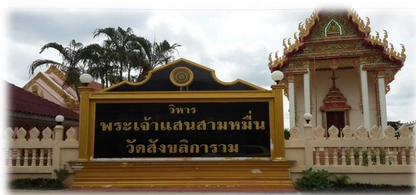
ภาพ : วัดสังขลิการาม อำเภอลำทะเมนชัย

๖) วัดสังขลิการาม อำเภอลำทะเมนชัย เป็นวัดที่ประดิษฐานพระเจ้าแสนสามหมื่น ซึ่งเป็นพระพุทธรูปสร้างในสมัยเชียงแสนเป็นราชธานี ประมาณ ๘๐๐ ปีมาแล้ว เจ้าอนุวงศ์แห่งนครเวียงจันทน์ ได้อัญเชิญพระเจ้าแสนสามหมื่น มาประดิษฐานไว้ในหอไตร (เวียงจันทน์) ในขณะที่นครเวียงจันทน์นั้นทำสงครามกับข้าศึก ชาวบ้านจึงนำพระพุทธรูป พระสุก พระเสริม พระใส พระแสน และพระเสียง หลบข้าศึกล่องแพตามลำน้ำจันทน์มาเรื่อย ๆ เกิดแพแตก แผ่นพระสุกตกลงไปในน้ำ ที่บริเวณนั้นชาวบ้านจึงเรียกว่าบ้านวินแผ่นและเมื่อล่องเรือมาถึงปากน้ำจันทน์เกิดแพแตกอีก พระสุกได้ตกลงน้ำได้สูญหายไป บริเวณพระสุกตกน้ำนั้นเรียกว่าวินสุก ต่อมาเมื่อซ่อมแพเสร็จแล้วจึงนำแพล่องมาถึงโพนพิสัย ชาวโพนพิสัยจึงอัญเชิญพระเจ้าแสนสามหมื่นกับพระเสียงไว้ที่วัดนิโคตร และเมื่อแพได้ล่องมาถึงหนองคายชาวหนองคายจึงได้อัญเชิญพระใสประดิษฐานไว้ที่วัดโพธิ์ชัย ส่วนพระเสริมนั้นได้อัญเชิญไปประดิษฐานที่วัดประทุมวนาราม กรุงเทพฯ เจ้าอธิการจันทน์ มังศรี ได้ไปอัญเชิญพระเจ้าแสนสามหมื่นจากโพนพิสัยมาประดิษฐานไว้ที่บ้านโศ