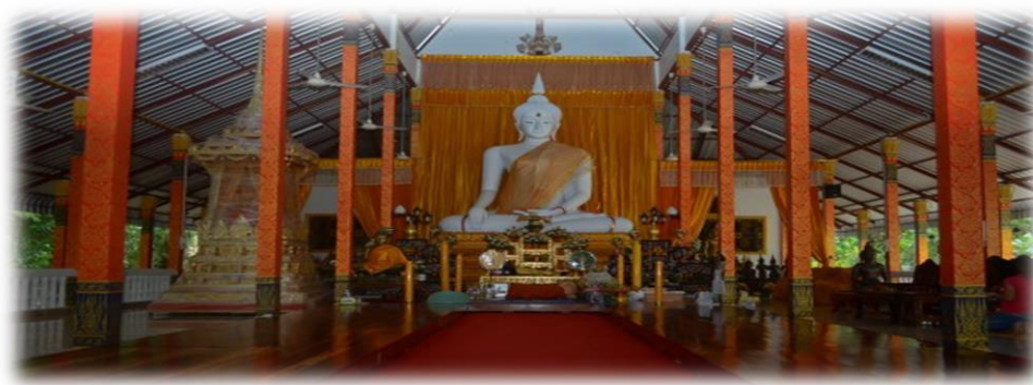
ภาพ : วัดเชกาเจติยาราม (พระอารามหลวง) อำเภอลำทะเมนชัย จังหวัดบุรีรัมย์

๘) น้ำตกถ้ำพระ หรือน้ำตกถ้ำพระภูว ตั้งอยู่บริเวณเขตรักษาพันธุ์สัตว์ป่าภูว บ้านถ้ำพระ ตำบล โสกเก้ง อำเภอลำทะเมนชัย จังหวัดบุรีรัมย์ เป็นน้ำตกขนาดใหญ่ ๓ ชั้น ที่ไหลอยู่บนภูเขาหินทรายขนาดใหญ่ เป็นสถานที่ท่องเที่ยวพักผ่อนหย่อนใจของนักท่องเที่ยวที่มาเที่ยวชมความงามของน้ำตก นอกจากนี้ยังมีแอ่งน้ำ ขนาดใหญ่และร่องน้ำที่สามารถเล่นเป็นสไลเดอร์ได้ ทำให้เล่นน้ำกันในลำธารกันอย่างสนุกสนาน แต่น้ำตกจะ มีน้ำมากในฤดูฝนช่วงเดือนกรกฎาคม-ต้นตุลาคม เท่านั้น หากมาในช่วงเดือนอื่นน้ำค่อนข้างน้อยมาก